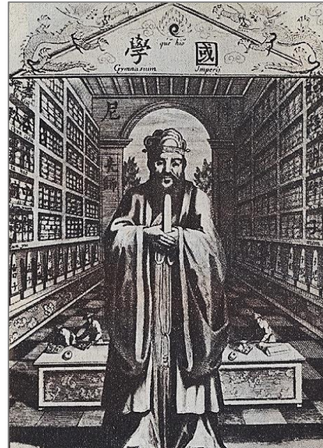
Конфуций европеизированный. Учитель Кун как покровитель просвещения. С европейской гравюры XVII в. (из книги «Конфуций» В. В. Малявина)

вопросы об истоках этого мировоззрения, охватившего все слои китайского общества в рассматриваемую эпоху и дошедшего до наших дней.