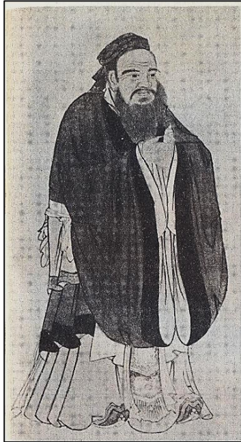
Наставляющий Конфуций. С картины художника «У Даоцзы», из книги В.В. Малявина «Конфуций»

конфуцианства в книге «Конфуций», на родине мудреца, устраивается праздник, на котором процессия в костюмах императорской эпохи торжественно возносит жертвы величайшему Учителю Поднебесного мира [3, с. 11].